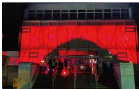
▲ Het huis van de Sint.

We hebben allemaal onze buik vol van corona. Andere jaren zijn er vele buurtfeesten om met iedereen te praten en te luisteren naar wat er leeft. Dit viel weg, een grote leegte. We hebben de knop omgedraaid en ons toegespitst op andere manieren om elkaar te ontmoeten.