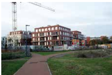
▲ Nieuwe sociale appartementen in Molenveld.

Wie door Herent rijdt ziet het meteen: in het Molenveld staan grote bouwkransen en verrijzen nieuwe woningen letterlijk uit de grond. Te midden van de privéappartementen komen er aan de kant van het milieupark drie gebouwen met in totaal 80 sociale woonappartementen, gebouwd door Volkswoningbouw. Ook aan de Persilbrug komen er sociale woonappartementen bij, verdeeld over drie blokken nog eens 50 wooneenheden.