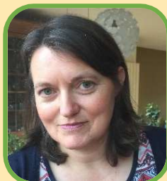
Astrid Pollers burgemeester

Wie stemt, kiest mee: u stemt in oktober toch ook? Prettige zomer!