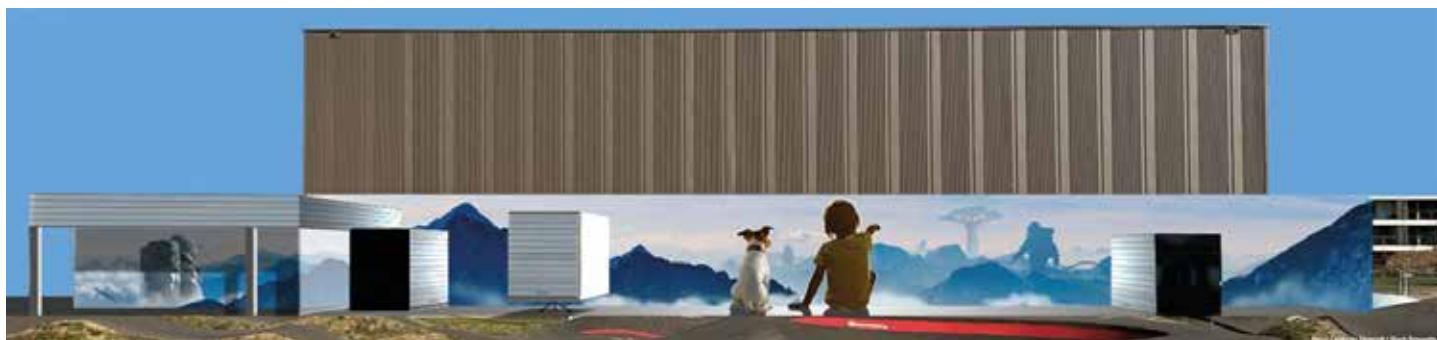
Saaie muren maken plaats voor graffitikunst.

Laat de jeugd maar los: weg met grijze muren en de verbeelding aan de macht! De grote muur van het sportcentrum Bart Swings, naast de pumtrack, werd onder handen genomen door graffitikunstenaar Smates (spreek uit als smeejts). Een hond, een kind, een ruimtevaarder en in de verte een apenbroodboom ... Alsof we middenin een berglandschap genieten van het uitzicht. Herentse jongeren kunnen samen met Smates experimenteren en aan hun eigen creaties werken. Kom zeker eens kijken!