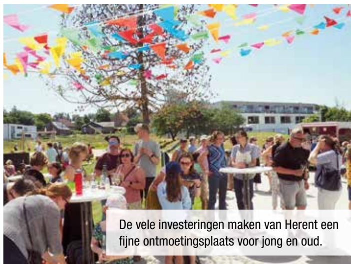
De vele investeringen maken van Herent een fijne ontmoetingsplaats voor jong en oud.

Dankzij onze gezonde gemeentefinanciën hebben we de mogelijkheid om iets te doen voor u, de Herentenaar! Er zijn budgetten om Herent beter en mooier te maken, om de dienstverlening te verbeteren en om plaatsen te creëren waar u met uw familie, vrienden of kennissen samen kan zijn. Dat hadden we u beloofd!