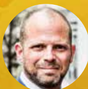
Theo Francken Kamerlid

Vlaamse arbeidsmarkt in Vlaamse handen. Willen we echt werk maken van een Vlaams arbeidsmarktbeleid, dan moeten de hefboomen ook in eigen handen komen.