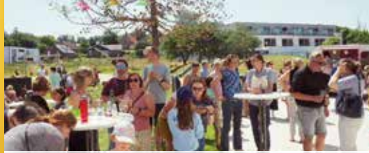
We maken Herent mooier en beter (p. 2)